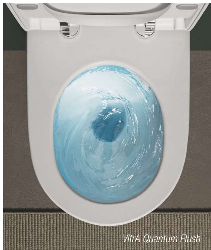
VitrA Quantum Flush

VitrA (hall 2.2, stand F056) , dont l'offre d'ensemblier est toujours plus profonde, met notamment en avant Quantum Flush, conçu pour optimiser l'énergie de l'eau lors de la chasse, qui atteint une performance maximale grâce au principe d'écoulement laminaire, offrant un rinçage de la cuvette 31 % plus efficace que la normale, avec les mêmes volumes d'eau, soit 3/6 litres. De plus, les éclaboussures sont supprimées et le niveau sonore parmi « les plus silencieux au monde ». Le salon est aussi l'occasion de découvrir Outline , une vasque unique en son genre, fabriquée en céramique recyclée : l'impact environnemental est réduit d'un tiers ! Ou encore la gamme de robinetterie Flow line, dotée de la solution V-SuperFix : 15 secondes suffisent pour installer, sans outil, grâce à sa fixation réglable manuellement. Teaser : après Métropole, le studio Noa a dessiné une nouvelle collection, attendue pour 1er trimestre 2025 !