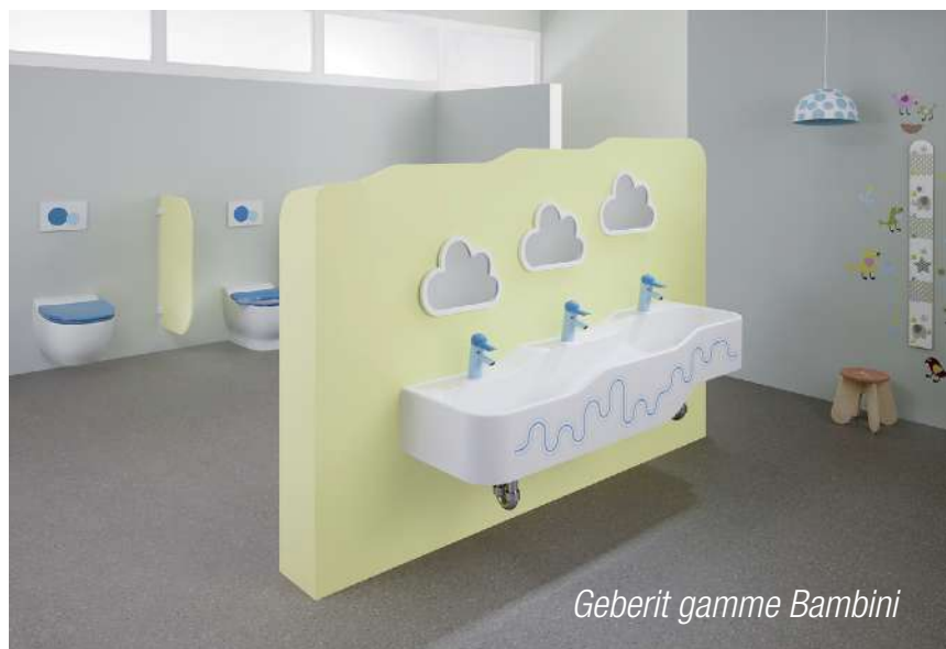
Geberit gamme Bambini