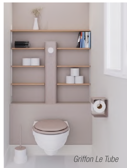
Griffon Le Tube

Griffon (hall 2.2, stand F044) lance, en collaboration avec Clara, autre fabricant français spécialiste de l'équipement des WC, Le Tube, un réservoir de chasse tubulaire et apparent, qui est aussi la colonne vertébrale d'un système de rangement modulable et adaptable. Relié par des tablettes à une autre colonne (ou pas) avec range-papier toilette et brosse, il devient un meuble. La chasse, interrompable grâce à un bouton poussoir start and stop, permet de choisir la quantité d'eau nécessaire.